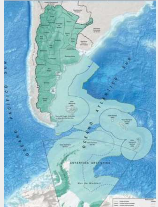
Mapa de la Argentina con espacios marítimos, IGN.