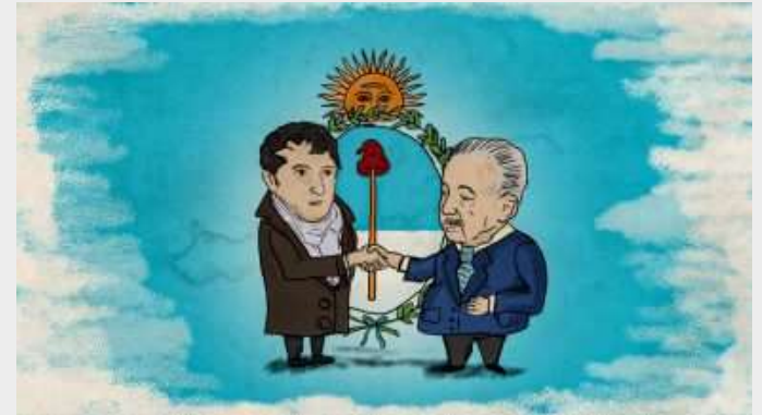
Belgrano y Diamand

Alimentado por el Foro Universitario del Futuro y otros insumos elaborados por el Programa